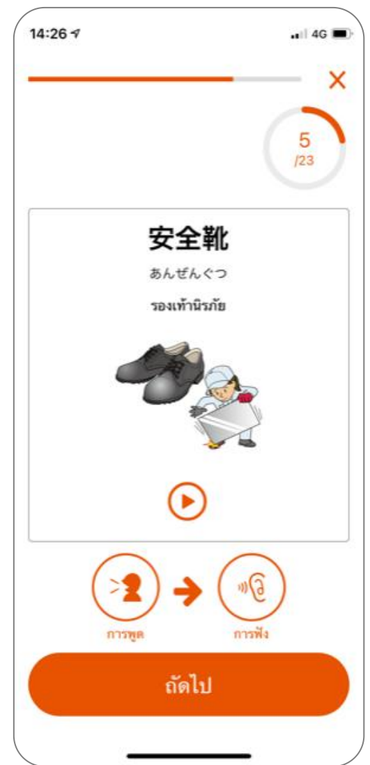
※ภาพการใช้งาน

● แอปพลิเคชันนี้ ได้พัฒนาขึ้นมาโดยองค์กรผู้ฝึกงานด้านเทคนิคสำหรับชาวต่างชาติเพื่อจุดประสงค์ในการเรียนรู้ภาษาญี่ปุ่นที่จำเป็นสำหรับผู้ฝึกงานด้านเทคนิค เพื่อการเรียนรู้ฝึกทักษะที่เหมาะสม ติดตั้งและใช้งานได้ฟรี※จำเป็นต้อง