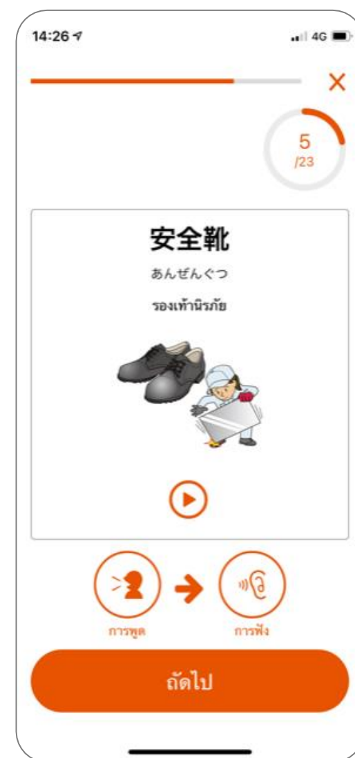
※ภาพการใช้งาน

● แอปพลิเคชันนี้ ได้พัฒนาขึ้นมาโดยองค์กรผู้ฝึกงานด้านเทคนิคสำหรับชาวต่างชาติเพื่อวัตถุประสงค์ในการเรียนรู้ภาษาและการสนทนาในสถานที่ทำงานในหน่วยงานที่จัดการฝึกงานด้านเทคนิค ติดตั้งและใช้งานได้ฟรี